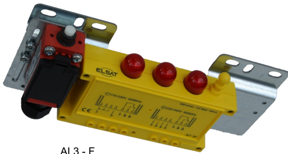
AL3 - F